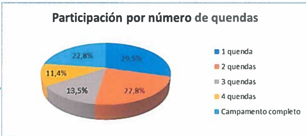
Figura 1: Porcentaxe de participación no Verán CampUSC 2022 por quenda

O número total de rapaces e rapazas inscritos foi de 193, cun total de 531 inscricións, participando nunha única quenda o 29,50%, en dúas o 22,80%, en tres quendas o 13,50%, o 11,40% en catro quendas e o 22,80% no campamento completo (ver Fig.1).